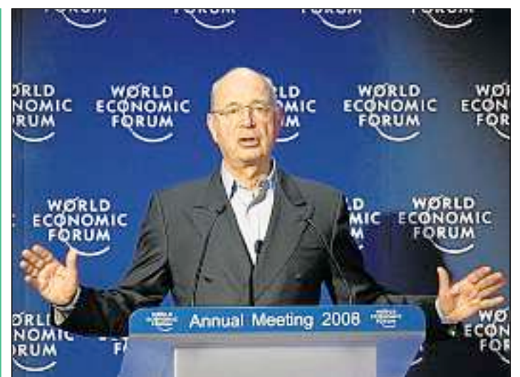
Klaus Schwab – il fundatur ed il parsura dal Forum economic mundial. KY