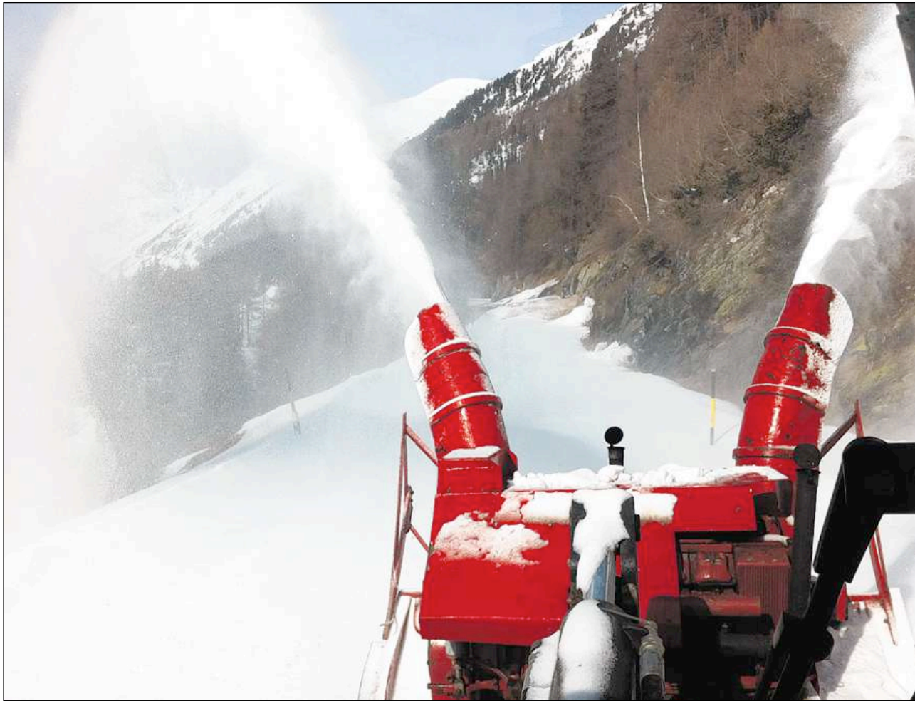
Un tagliuorn da naiv cumainza a rumir la naiv sün via, davo rivan nanpro eir las maschinas plü grondas per rumir lavinas e scufflas.